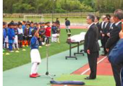
理事長杯少年サッカー大会