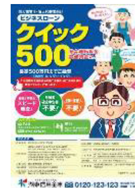
ビジネスローン「クイック 500」

平成 27 年 3 月より商工会・商工会議所との提携による事業者向けビジネスローン「クイック 500」を取扱っております。