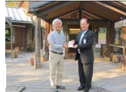
保全活動 (河辺いきものの森)