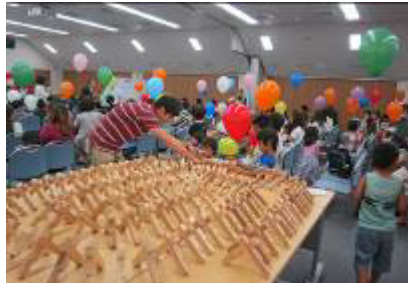
夏休みこどもフェスティバル

また、毎年8月に地域のお子様方を対象にした、「夏休みこどもフェスティバル」の開催や、役職員の有志による東近江市「こども未来夢基金」への継続的な寄付、営業エリア内の小学生を対象とした湖東信用金庫理事長杯少年サッカー大会（5月に17チームが参加）の開催、職場体験学習として地域の中学生の受け入れ（9月に能登川中学校2名）、などにより、地域との子育て支援を通じた繋がりを図っております。