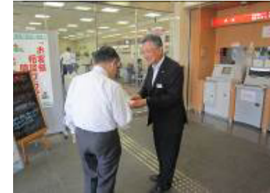
振込め詐欺防止啓発活動 (湖東信用金庫本店)

滋賀県警からの要請により、平成 26 年 12 月から高額な現金を引き出しされる高齢のお客さま等に対して、預金小切手での払い出しを推奨しています。(通称：預手プラン)