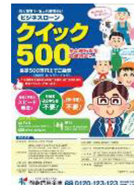
ビジネスローン「クイック 500」

経営改善・事業再生・事業承継等が必要なお客さまへの支援については、平成 29 年度において、当金庫が窓口となって再生支援協議会等の外部機関と連携して経営改善計画を策定したお客さまのうち、条件変更を実施している場合であっても、当該計画に沿って、8 先の