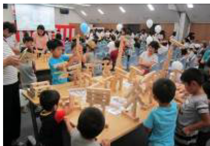
夏休み子どもフェスティバル （湖東信用金庫本店5階コミュニティホール）

また、毎年8月に地域のお子様方を対象にした、「夏休み子どもフェスティバル」の開催や、営業エリア内の小学生を対象とした湖東信用金庫理事長杯少年サッカー大会（5月に16チームが参加）の開催、役職員の有志による東近江市「こども未来夢基金」への継続的な寄付などにより、地域との子育て支援を通じた繋がりを図っております。