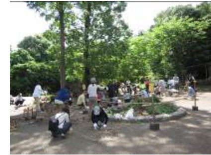
保全活動 (河辺いきものの森)