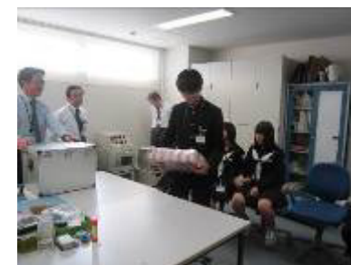
職場体験学習 （湖東信用金庫本店）

地域の中学校から職場体験学習の受け入れを実施しています。平成29年度は、3校（9月に東近江市立能登川中学校2名、11月に同市立永源寺中学校3名および同市立聖徳中学校3名）の受け入れに協力し、「信用金庫の仕事」、「金融の役割」、「マナー」について学習しました。また、出前講座については、29年度に4回（甲賀大原小学校、甲南第3小学校、水口中央公民館）実施しました。