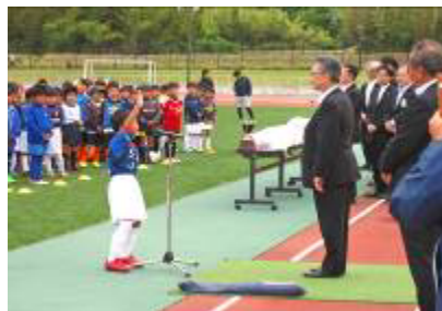
理事長杯少年サッカー大会 （布引グリーンスタジアム）