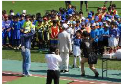
理事長杯少年サッカー大会