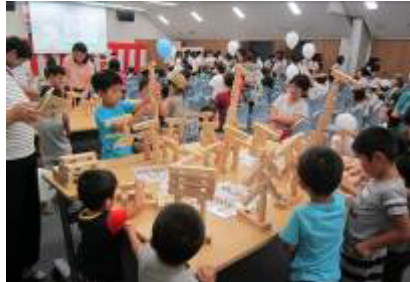
夏休み子どもフェスティバル

また、毎年8月に地域のお子様方を対象にした、「夏休み子どもフェスティバル」の開催や、役職員の有志による東近江市「子ども未来夢基金」への継続的な寄付、営業エリア内の小学生を対象とした湖東信用金庫理事長杯少年サッカー大会（5月に16チームが参加）の開催、職場体験学習として地域の中学生の受け入れ（9月に能登川中学校2名）、などにより、地域との子育て支援を通じた繋がりを図っております。