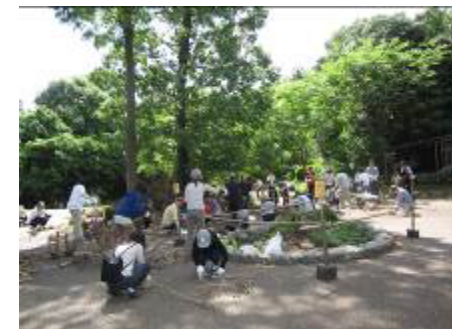
保全活動 (河辺いきものの森)