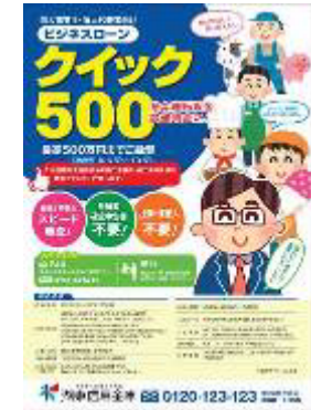
ビジネスローン「クイック 500」

地域の中小企業および個人のお客さまへの安定した資金供給は、事業地域が限定された協同組織金融機関である当金庫にとって、最も重要な社会的使命です。