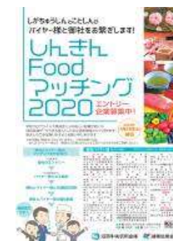
しんきん Food マッチングフェア

2020年におきましては、新型コロナウイルス感染拡大防止の観点から対面型での開催は中止し、非対面にて「しんきん Food マッチングフェア」を地元の「食」に関する事業を行っている事業者への支援を目的として開催しました。