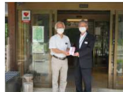
河辺いきものの森への寄付