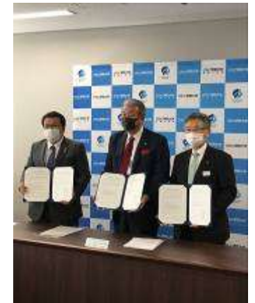
包括連携協定締結