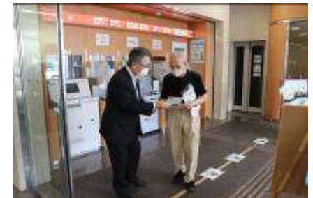
振込め詐欺防止啓発活動 (湖東信用金庫本店)

滋賀県警からの要請により、平成 26 年 12 月から高額な現金を引き出しされる高齢のお客さま等に対して、預金小切手での払い出しを推奨しています。(通称：預手プラン)