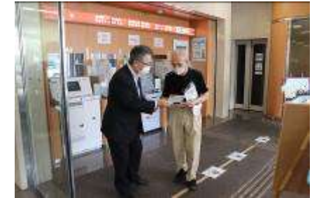
振込め詐欺防止啓発活動 (湖東信用金庫本店)

地域の高齢者向け福祉施設等で開催される盆踊り大会などの行事への参加、親善ゲートボール大会などのスポーツ振興イベントの開催を通じて、地域の高齢者の方々との繋がりを図っておりますが、2020年度上半期は、新型コロナウイルス感染拡大防止の観点から開催を中止いたしました。