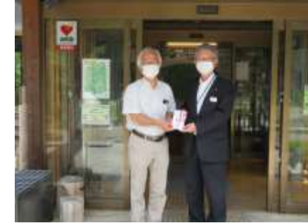
河辺いきものの森への寄付