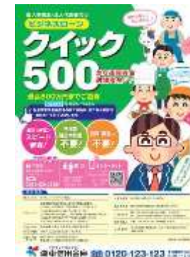
ビジネスローン「クイック500」

平成27年3月より商工会・商工会議所との提携による事業者向けビジネスローン「クイック500」を取扱いしております。