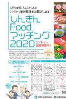
しんきん Food マッチングフェア

2020年度上半期は、小規模事業者持続化補助金6件、モノづくり補助金5件を含む19件の補助金等申請のお手伝いを行いました。